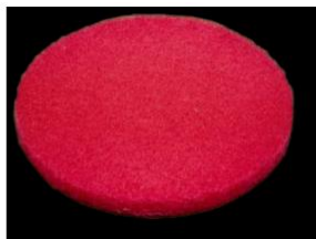
Красный пад (диаметр 33 см)