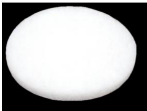
Белый пад (диаметр 33 см)