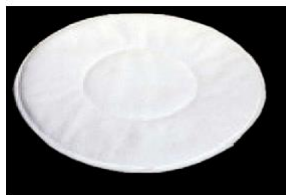
Пад из микрофибры (диаметр 33 см) под заказ