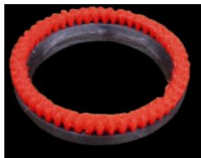
Щеточное кольцо под заказ